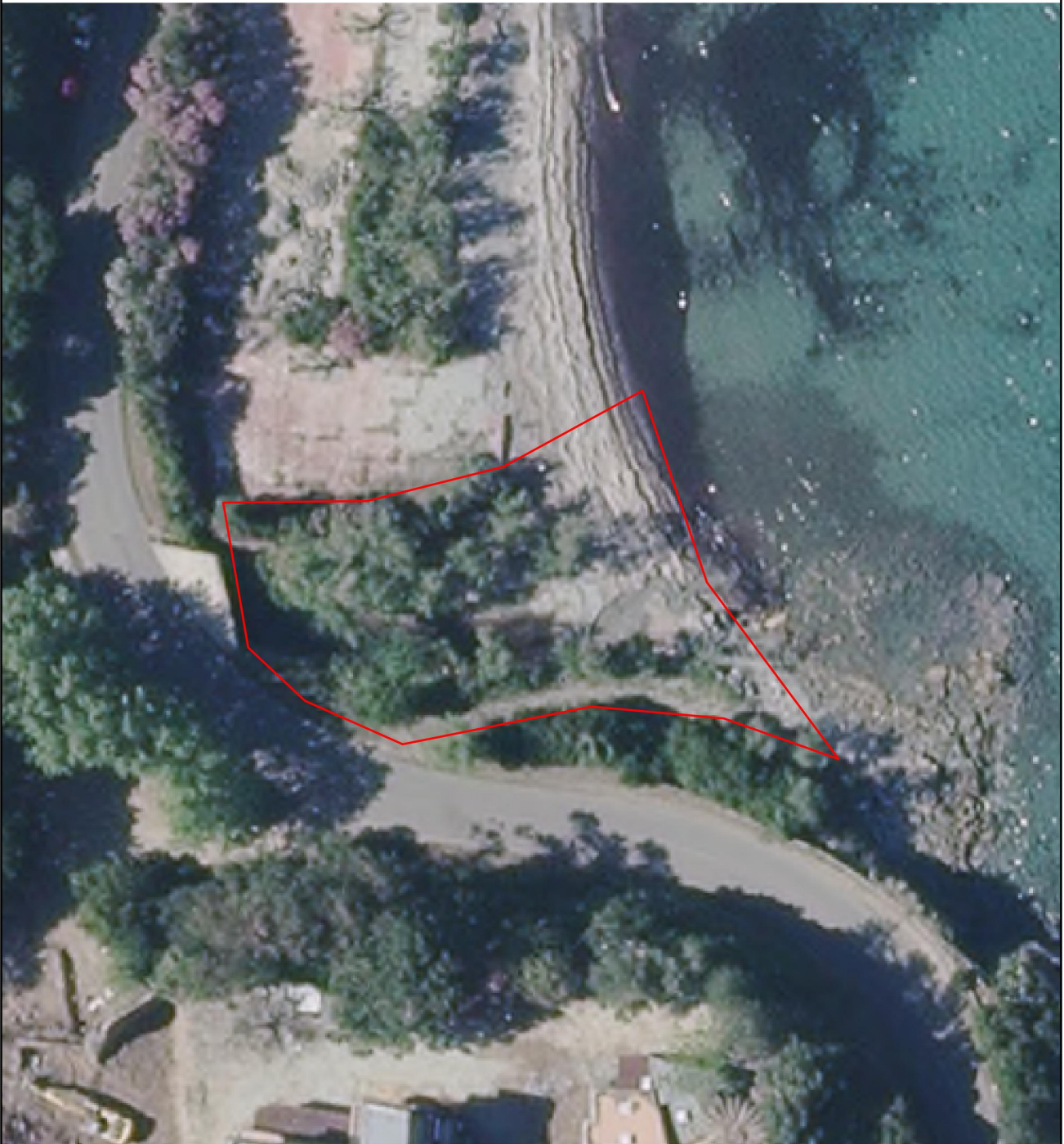
Image satellite : BD ORTHO-HR® 2019 (IGN/Collectivité de Corse) - Lambert 93