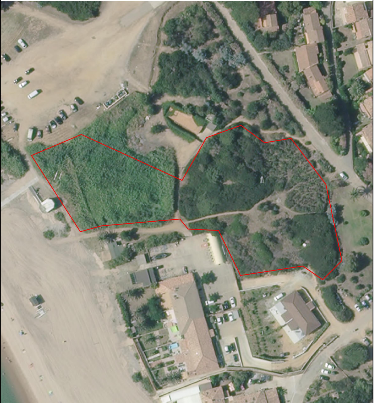
Image satellite : BD ORTHO-HR® 2019 (IGN/Collectivité de Corse) - Lambert 93