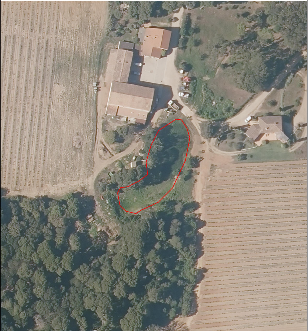
Image satellite : BD ORTHO-HR® 2019 (IGN/Collectivité de Corse) - Lambert 93