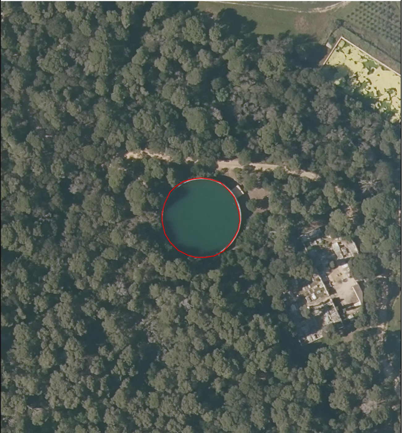
Image satellite : BD ORTHO-HR® 2019 (IGN/Collectivité de Corse) - Lambert 93